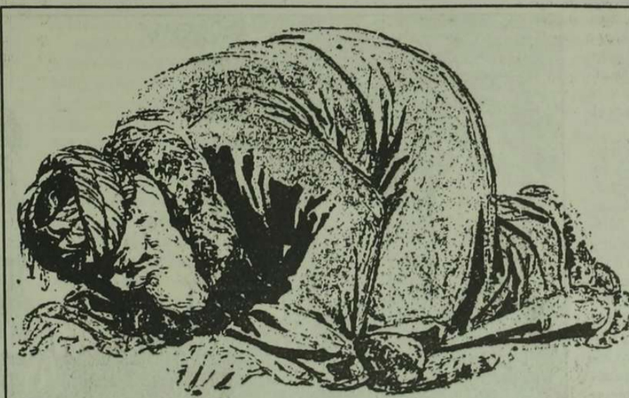
Utazásaira magával vitte Széchenyi István a családja alkalmazásában álló festőművészt, Johann Endert. Ender azután – mint a mai fotóriporterek – a gróf által fontosnak tartott képeket örökítette meg. Így készült a keleti utazás során az imádkozó török férfi rajza is.

A spontán hitélményei racionális keretbe foglalására törekvő gróf gon-